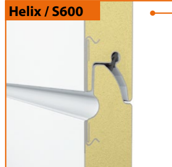
Helix / S600