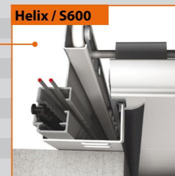
Helix / S600

Vlak aansluitende, verstelbare zijscharnieren die nauwelijks uitsteken zijn daardoor extra veilig. De scharnieren zorgen voor een perfecte verticale afdichting.