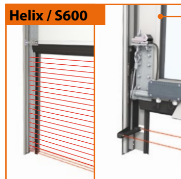
Helix / S600

Heeft u speciale wensen op het gebied van kleur? Ook dan biedt Alpha een kleurwaaier aan mogelijkheden.