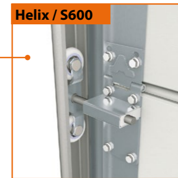
Helix / S600

De Helix spiraaldeur rolt zich compact op tot een pakket tegen de binnengevel van de hal. De benodigde inbouwruiimte boven aan de rails bedraagt 1100 x 1200 mm, als zijruimte heeft u aan de niet aandrijfszijde 120 mm nodig en aan de aandrijfszijde 350 mm.